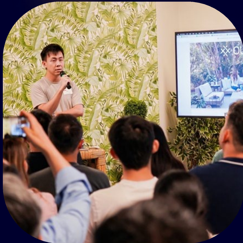
深度参与美国主流市场的人