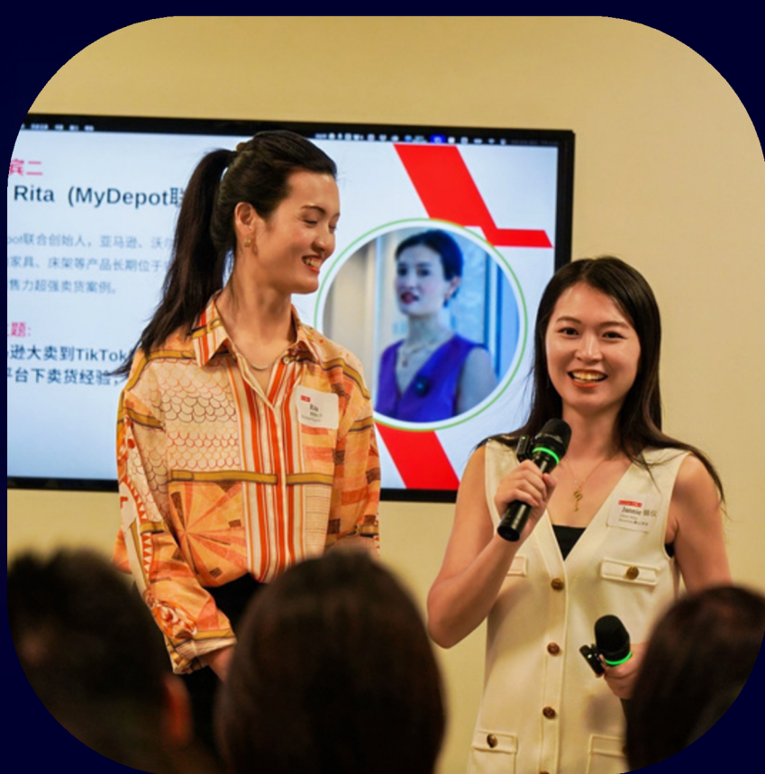
美国本土创业者 & 企业主