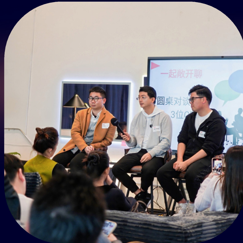
拥有工厂、供应链、渠道资源的实干派