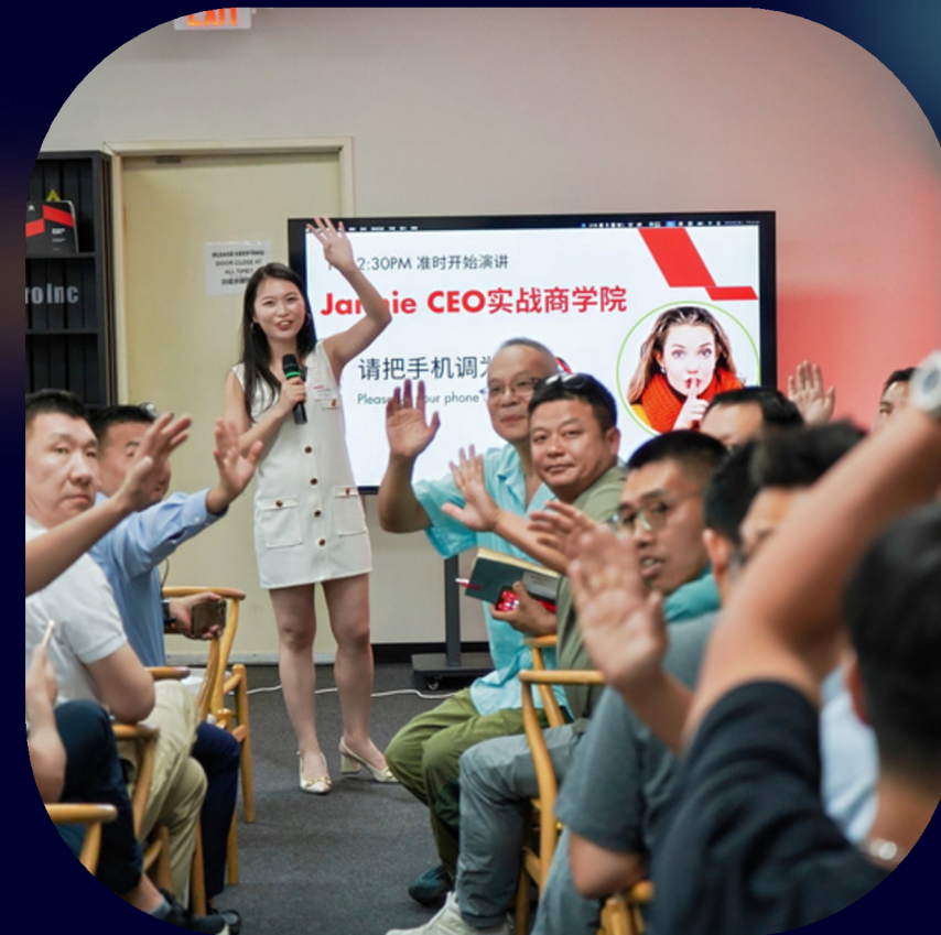
投资人、连续创业者、各行业领域专家

在 BossHub，你面对的不是“陌生人”，而是 可能与你产生长期合作的同路人 。